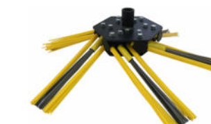
6x3 mit Poly-Stahl-Mix

Alternativ zum serienmäßigen Wildkraut-Kopf mit Standard-Stahlbürsten sind für alle Greenbuster-Modelle zusätzliche Roadsweeper Köpfe erhältlich. Diese sind je nach Modell mit verschiedenen Bürsten bestückbar. Mit diesen Besenköpfen lassen sich zum Beispiel in Herbst und Winter Laub oder Schnee fegen, empfindliche Steine noch oberflächenschonender reinigen oder regelmäßiger arbeiten und nachwachsendes Grün entfernen.