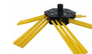
6x3 Poly Bürstensatz