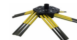
6x3 mit Stahl Standard