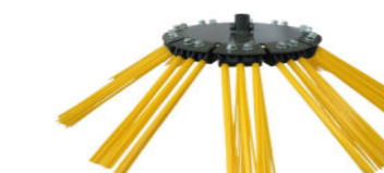
10x3 mit Poly-Bürsten