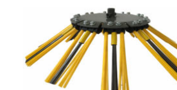
10x3 mit Poly-Stahl-Mix